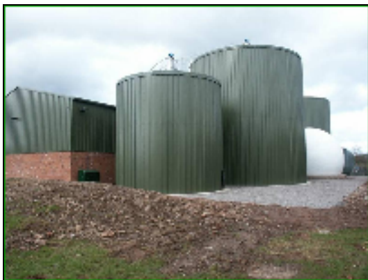
Uchod – llun o gyfleuster AD Isod – llun o'r cysyniad sylfaenol